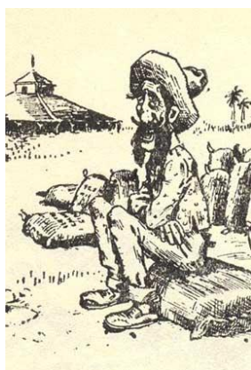
Ilustración 1 Liborio, de Ricardo de la Torriente