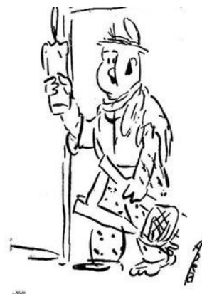
Ilustración 2 El Bobo, de Eduardo Abela