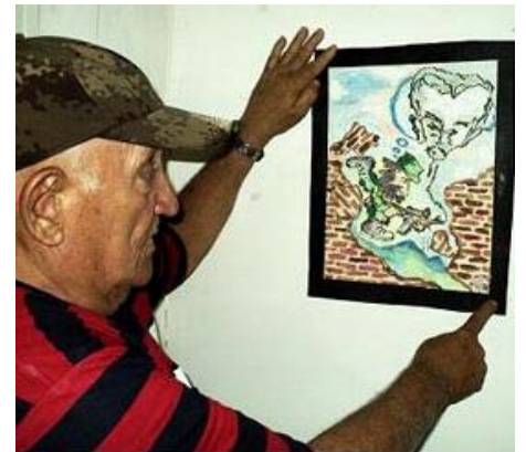
Ilustración 5. Quintana señala una de las caricaturas dedicadas a la gesta del Moncada