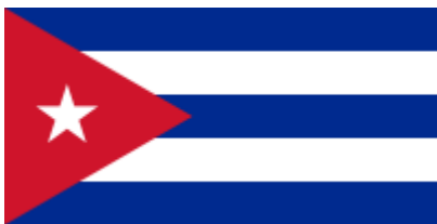
Ilustración 1 La Bandera de la Estrella Solitaria